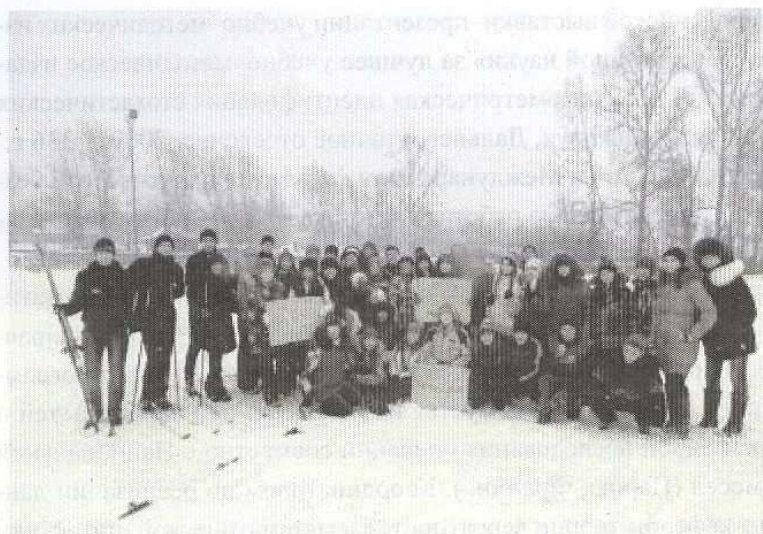
Зимняя эстафета ФПМК