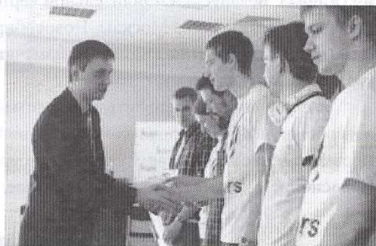
Команда Sibears на соревнованиях RuCTF-2013

Тематика журнала «Прикладная дискретная математика» охватывает следующие направления прикладной дискретной математики: теоретические основы дискретной математики; математические методы криптографии; математические основы компьютерной безопасности; математические основы надежности вычислительных и управляющих систем; прикладная теория кодирования; прикладная теория автоматов и др.