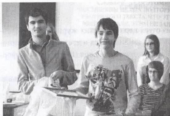
Интеллектуальная игра ФПМК, в которой приняли участие школьники 9–11 классов

ный статусы были представлены из 50 очных участников 33 иногородними, 2 – зарубежными (Канада, Беларусь). Отличительной чертой этой конференции стало большое количество молодых участников из Москвы, Новосибирска, Томска; всем запомнились экскурсия в Нарым (место ссылки И.В. Сталина) и замечательный фольклорный праздник в Парабельском краеведческом музее.