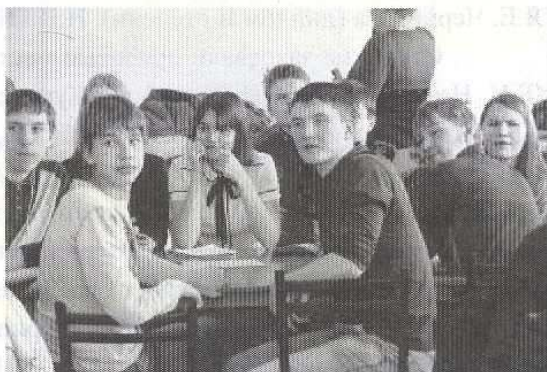
Старшеклассники на Дне открытых дверей